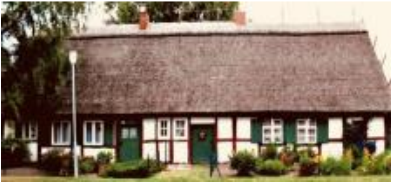
Haus in Steinmocker

*Nerdin 29.03.1929, aus oo-Bescheinigung